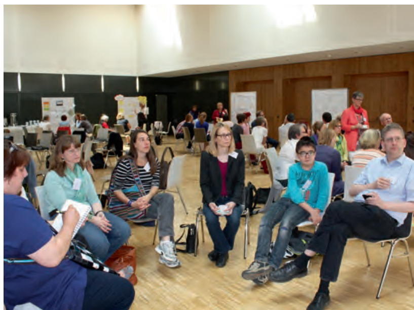
Viele Menschen, viele Meinungen: Das Konzept für die Modellregion wird auf der Tagung am 11. Mai 2015 diskutiert.

Außerdem arbeiten sie eng mit dem Qualifizierungs-Netzwerk für multiprofessionelle Teams zusammen.