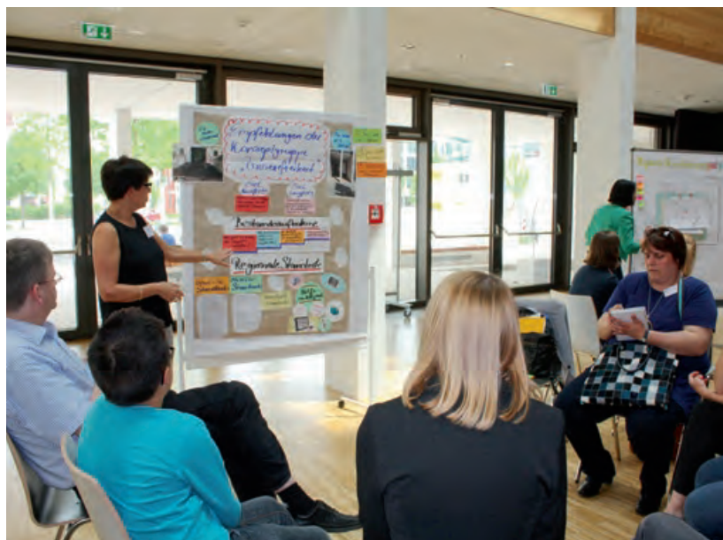
Ideen-Austausch: Menschen aus verschiedenen Berufen haben am Konzept für die Modellregion gearbeitet.

Deshalb wählt die Stadt Frankfurt zunächst ein paar Schulen aus, die barrierefrei umgebaut werden sollen.