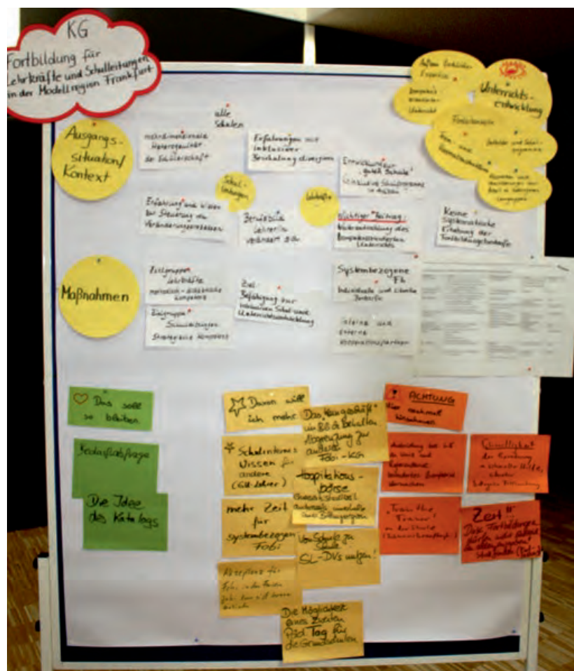
Ziele und Pläne: Alle Gedanken zur Modellregion werden gesammelt.

Auch in den Fortbildungen des Staatlichen Schulamts für neue Schulleiterinnen und Schulleiter an Grundschulen und Förderschulen soll Inklusion ein Thema sein.