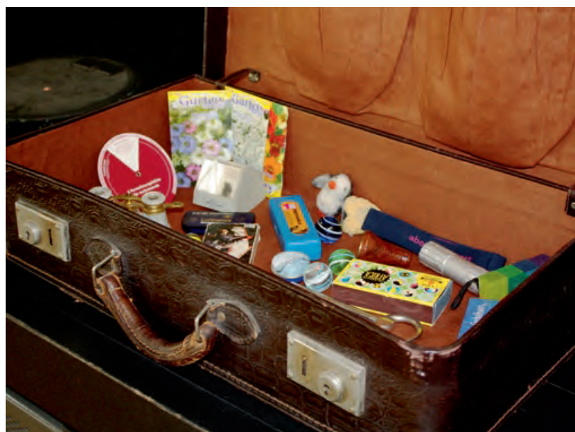
Ein Koffer mit Überraschungen: Teilnehmerinnen und Teilnehmer der Tagung zur Modellregion haben Dinge mitgebracht, die ihnen zu Schule und Inklusion einfallen.